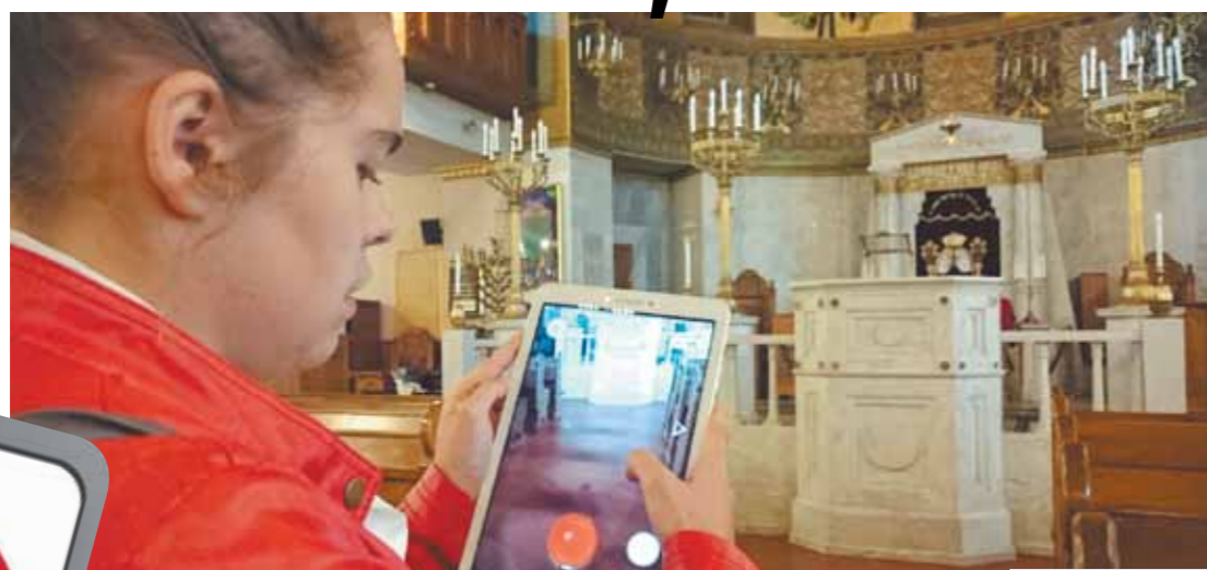
Репортер «МК» в храме

Репортеры «МК» проверили, есть ли риск попасть в тюрьму за охоту на покемонов в храмах