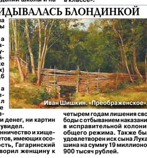
Иван Шишкин. «Преображенское»

Правила приема детей в первый класс изменятся в ближайшем будущем. Родителям придется потропиться с выбором школы и подающей заявлении. Кроме того, стать школьником в шесть лет не удастся даже самому одаренному малышу. Как стало известно «МК», новшества разработаны в Минобрнауки. Если они будут одобрены, принимать заявления от родителей школы станут до 24 апреля. На эту дату нужно будет ориентироваться семьям, которые решат отдать чадо в школу рядом с домом. По нынешним правилам прием заявления для них заканчивается 30 июня. Начало останется без изменений – 1 февраля. Все останется по-прежнему для тех, кто решит возить ребенка на учебу в другой район. Для них первым днем подачи заявления станет 1 июля, а приемная кампания продлится до 5 сентября. Правда, здесь будет один нюанс: если в школе после окончания приема всех желающих из своего района останутся свободные места, заполнить их «чужаками» она начнет уже с 25 апреля. До этой даты администрация учебного заведения обязана будет по новым правилам размещать информацию о наличии вакантных парт на стенде в здании школы и на