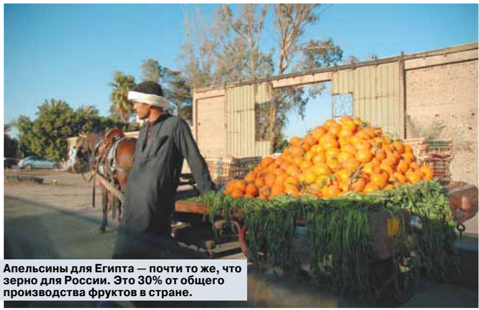
Апельсины для Египта — почти то же, что зерно для России. Это 30% от общего производства фруктов в стране.

Осенью прошлого года ситуация резко обострилась. Киев при поддержке правительства США и МВФ сумел договориться с клубом частных кредиторов