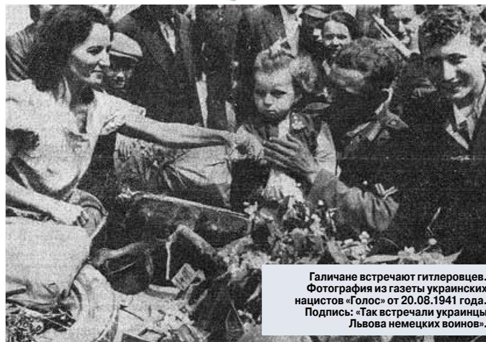
Галичане встречают гитлеровцев. Фотография из газеты украинских нацистов «Голос» от 20.08.1941 года. Подпись: «Так встречали украинцы Львова немецких воинов».