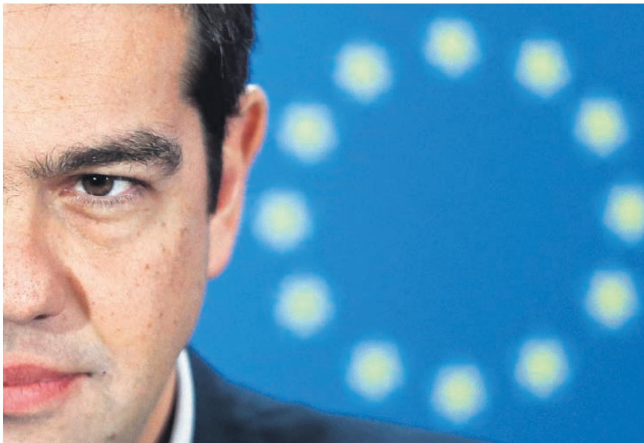
Новый премьер Греции Алексис Ципрас едет в Москву за кредитами, скидкой на газ, преференциями для греческих продуктов

Премьер Греции Алексис Ципрас сегодня приедет в Москву и в среду встретится с президентом Владимиром Путиным. В греческом правительстве „Ъ“ заявили, что надеются «добиться начала новой весны в отношениях между ЕС и Россией», а также вывести на новый уровень двустороннее сотрудничество. Источник „Ъ“ в правительстве РФ заверил, что Москва готова рассмотреть вопрос о предоставлении Афинам скидки на газ и новых кредитов, но будет ждать «встречных движений» — в частности, в плане получения Россией определенных активов в Греции». В Евросоюзе к новой политике греков относятся настороженно, предостерегая их от попыток «разрушить европейское единство».